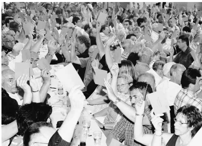
Sie üben schon mal für die spannende Kandidatenwahl später am Abend: CDU-Delegierte bei einer Abstimmung zur Geschäftsordnung in der Bitburger Stadthalle.

Ein Pulk aus Fotografen und Kameraleuten tummelt sich um den Kreisvorsitzenden Billen, als er ans Mikrofon tritt und die Sitzung eröffnet. Ganz Profi, begrüßt er die Spitzenkandidatin Klöckner besonders herzlich, obgleich die ihm zuvor ausgeschlagen hat, mit ihm Seite an Seite in die Stadthalle einzuziehen. Die nach Ortsverbänden aufgeteilte Sitzordnung spiegelt das Sympathiegefälle: Viele Mitglieder aus dem Nordkreis setzen auf „ihre“